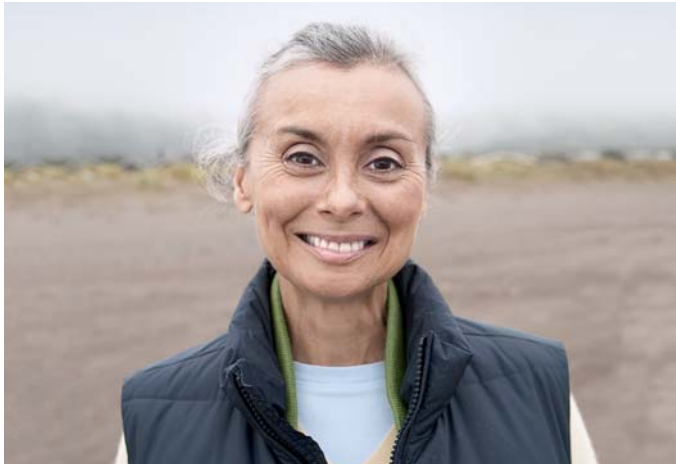
Vahvat, terveet hampaat vaikuttavat terveydentilaan ja hyvinvointiin.

Kiinnittämättömät proteesit ovat vanhanaikainen ratkaisu potilaille , jotka ovat menettäneet kaikki hampaansa. Niiden käyttäminen voi olla kivuliasta, hankalaa ja epä mukavaa. Tällaisilla proteeseilla joidenkin ruokien pureskelu on vaikeaa, minkä vuoksi monet joutuvat luopumaan joistakin lempiruuisistaan. Proteesi voi myös vaikuttaa sanojen lausumiseen ja siten koko puhetapaan.